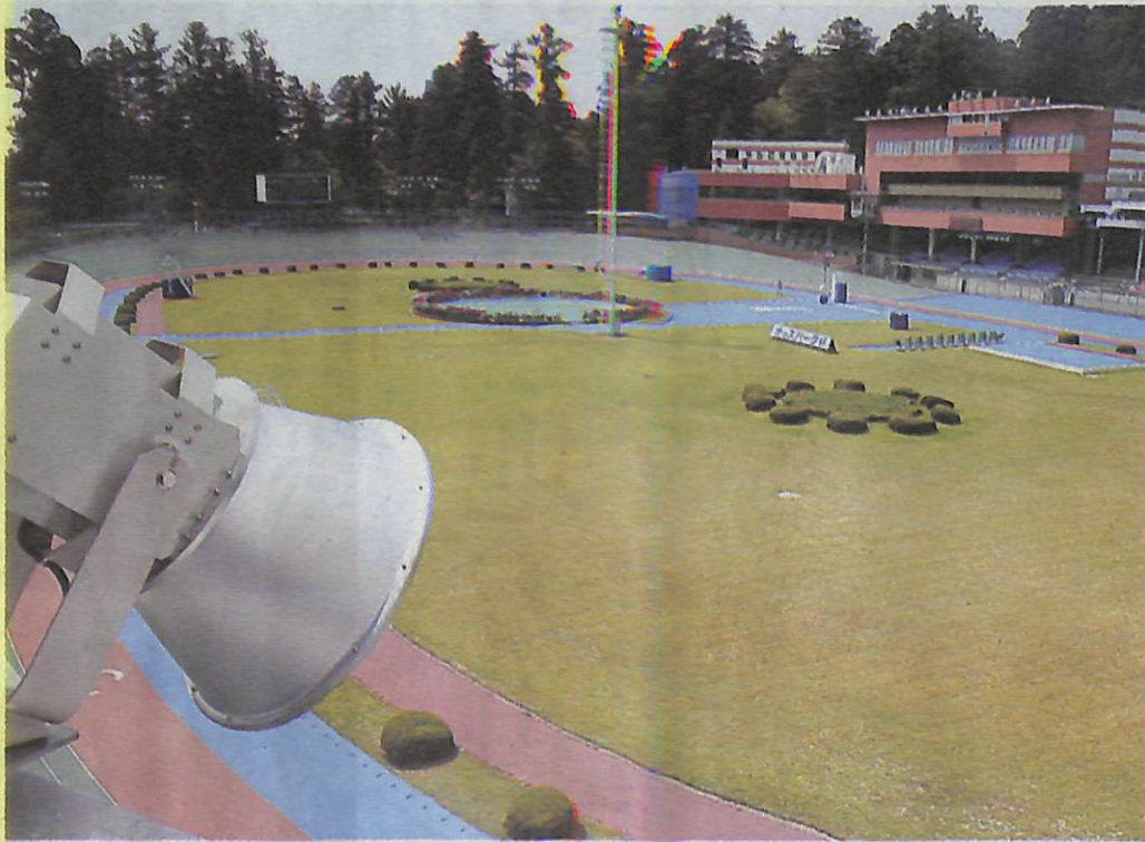
ミッドナイト競輪が開催される弥彦競輪場

弥彦村は五、六、七の三日間、弥彦競輪場で初めてとなるミッドナイト競輪を開催する。ミッドナイト競輪は深夜帯に開催される競輪で、弥彦村の開催は全国十一番目。昼間の普通開催を振り替えて開催するため、従来の赤字が解消されたうえに収益が確保され、弥彦村では一開催当たり七千万円、年間で二億一千万円の収支改善を見込んでいる。